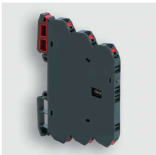
Convertidor analógico/analógico LCIS